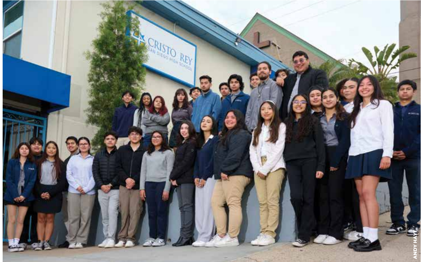
PIONEROS: En la foto vemos a los estudiantes de último año que se graduarán este 31 de mayo de la Escuela Secundaria Cristo Rey San Diego. Esta es la primera generación. Cristo Rey cuenta con un programa de estudio-trabajo que brinda experiencias inigualables a sus estudiantes.

Durante su primer año, trabajó en Precision Diagnostics, un laboratorio de salud en Sorrento Valley, donde asistía con los análisis de muestras. Durante el verano se le presentó una oportunidad para trabajar en Immuneering Corp., una empresa de biotecnología de rancho Bernardo que