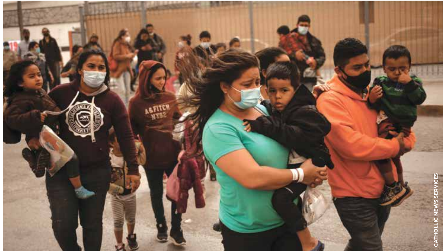
INSÓLITO: El estado de Texas está utilizando la presión gubernamental para restringir el trabajo de la Iglesia de ayudar a los más desamparados.

“Mientras los obispos católicos de todo el país se reúnen hoy en Texas en defensa de la libertad religiosa, los