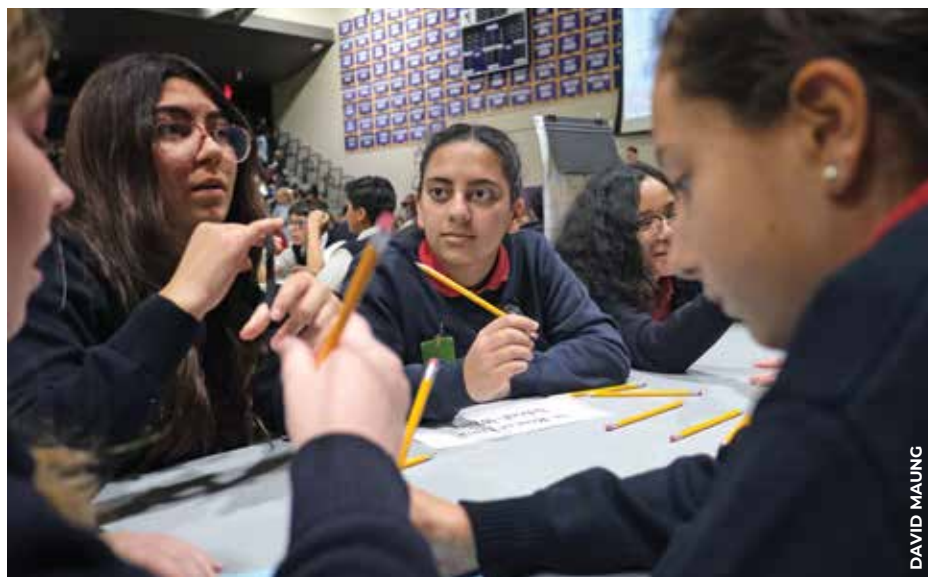
CONCENTRADAS. Estudiantes de la Escuela Santa Rosa de Lima en Chula Vista participaron en la Súper Quiz durante el Decatlón Académico de Secundaria que se realizó el 2 de marzo.