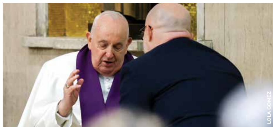
ESCUCHAR: El Papa Francisco escucha la confesión de un hombre durante el servicio de penitencia de Cuaresma el 8 de marzo, 2024 en la Parroquia de San Pío V en Roma.

“Concedamos siempre el perdón a quien lo pide y ayudemos a quien siente miedo a acercarse con confianza