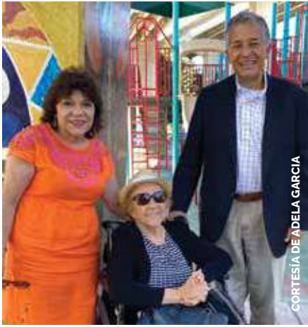
CORTESÍA DE ADELA GARCÍA