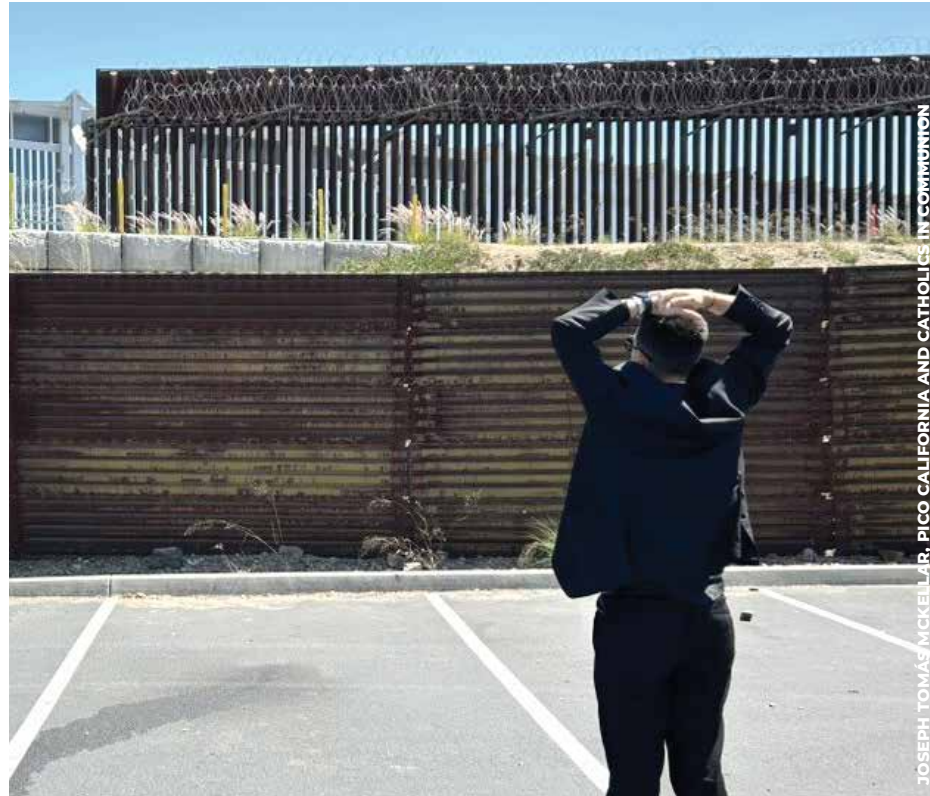
REALIDAD: Los visitantes también oraron frente al muro fronterizo que divide a EU y México.

Además, el sacerdote es capellán de la organización Mediterranea Saving Humans , que opera un barco dedicado al rescate de hombres, mujeres y niños que huyen del continente africano