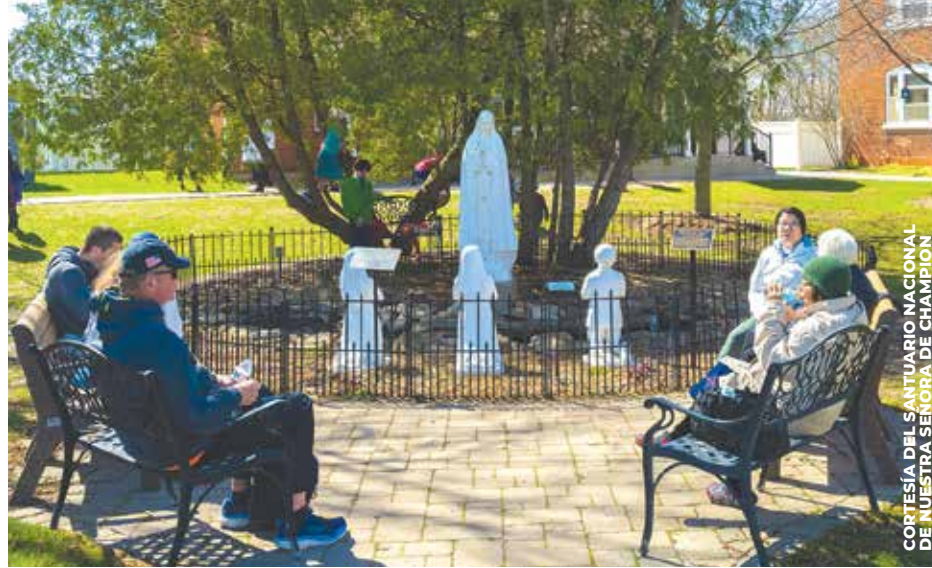
OPORTUNIDADES: El Santuario Nacional de Nuestra Señora de Champion, conmemorará el 250 aniversario del país con una exposición en sus instalaciones y con una “Novena por Nuestra Nación”, cuyas tarjetas de oración estarán disponibles en línea.

En la Diócesis de San Diego, se invita a los fieles a ver la transmisión en vivo de la consagración, el 11 de junio a través de usccb.org , y a unirse en oración con los obispos. Entre las sugerencias está rezar la novena y la oración al Sagrado Corazón