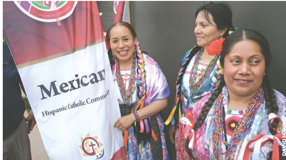
ORGULLO: Las diferentes culturas visten sus trajes típicos durante la Misa de Pentecostés.

La celebración inicia con una procesión encabezada por los Caballeros y Damas de San Pedro Claver, seguida por representantes de distintas culturas, desde África