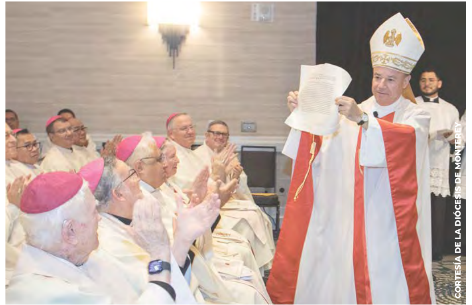
GOZOSO: El obispo Ramón Bejarano muestra el mandato apostólico del Papa León XIV que lo nombra el sexto obispo de Monterey durante su Misa de instalación el 19 de febrero.

Numerosos sacerdotes y personal pastoral de San Diego y de la Diócesis de Stockton — donde sirvió 21 años — lo acompañaron en este día significativo.