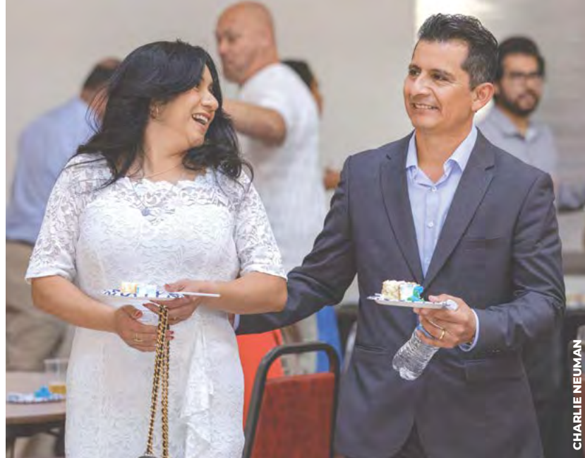
REGOCIJO: La alegría reinó durante la Misa Diocesana de Aniversario de Matrimonios el pasado 14 de febrero.