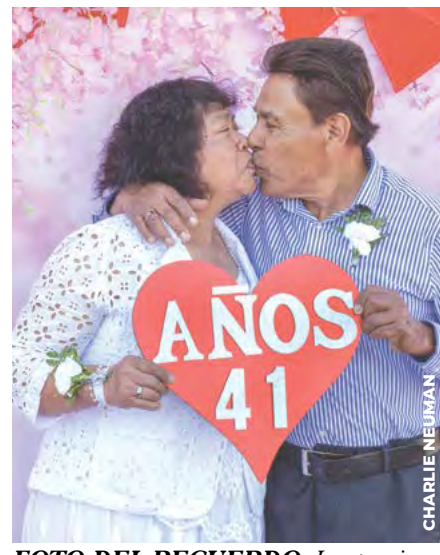
FOTO DEL RECUERDO: Las parejas posaron con alegría, mostrando los años de matrimonio que celebraban.