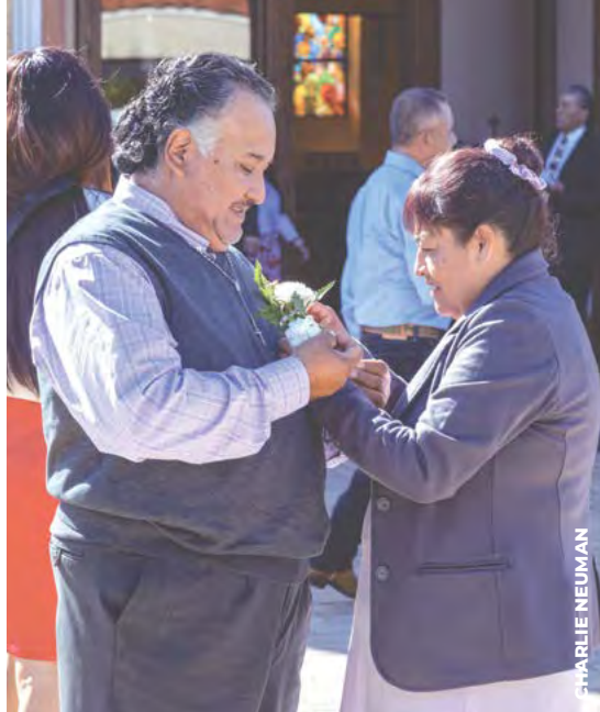
DE LA MANO: Varios matrimonios de toda la región celebraron el Día de San Valentín en una Misa especial.

“Los sacramentos de iniciación no son la meta final”, afirmó, “son el comienzo de la siguiente etapa en mi camino”.