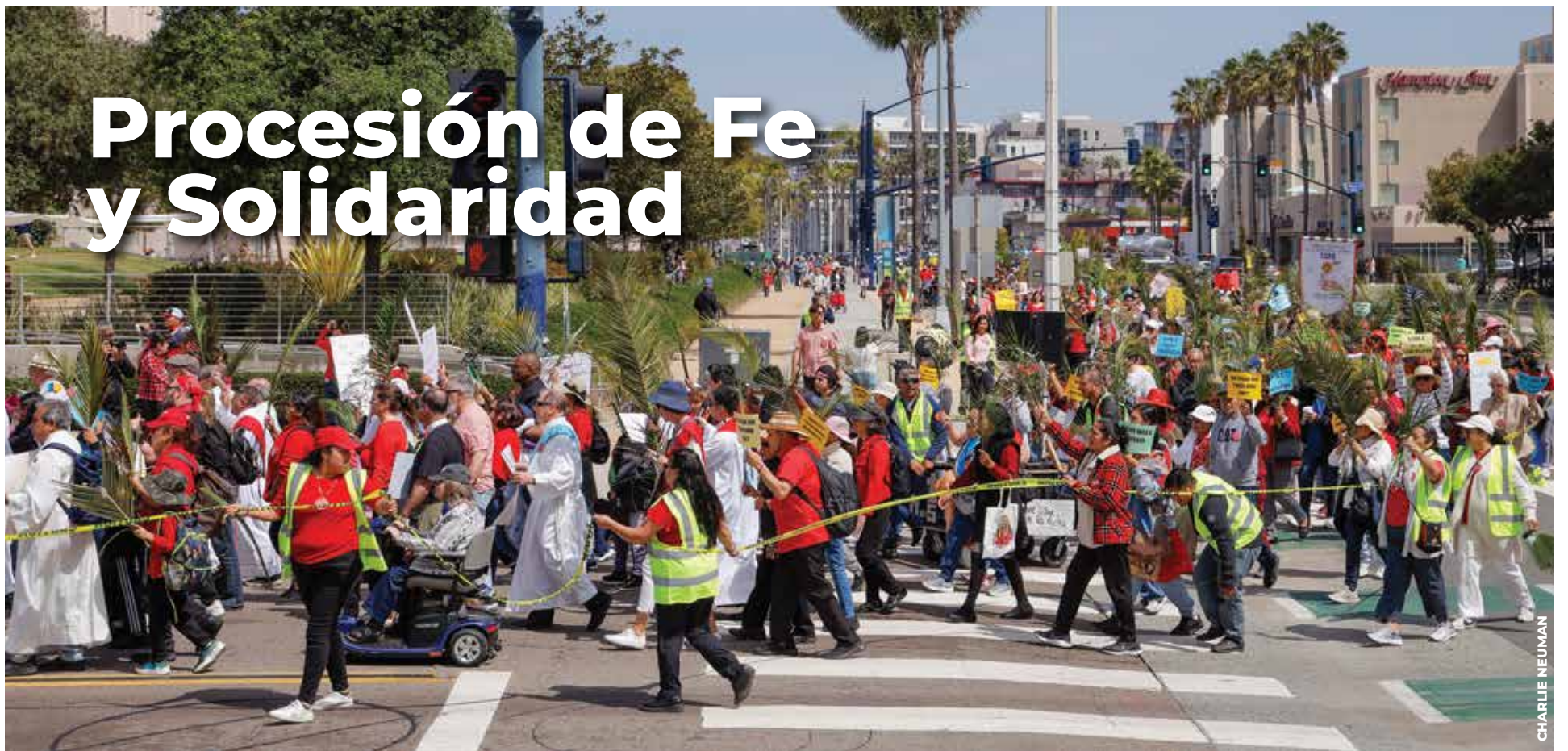
EN ACCIÓN. Con largas palmas y pancartas en mano, familias enteras recorrieron las calles del centro de San Diego el pasado 12 de abril para alzar la voz en favor de los más vulnerables.