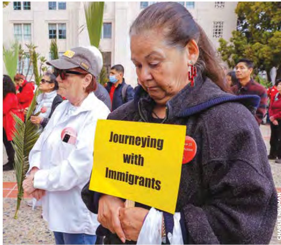
JUSTICIA. Cientos de fieles se unieron para apoyar a los inmigrantes y pedir al gobierno que continúe ofreciendo servicios y apoyo a quienes más lo necesitan.

participantes escucharon dos testimonios que reflejaron el sufrimiento de muchas familias.