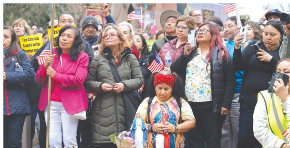
APOYO: La diócesis invita a la comunidad a un servicio de oración el 12 de abril, para abogar por los más vulnerables. El último servicio de oración, el 9 de febrero, reunió a unos 1 mil 500 fieles.

El evento comenzará a las 10 a.m. con un servicio de oración que