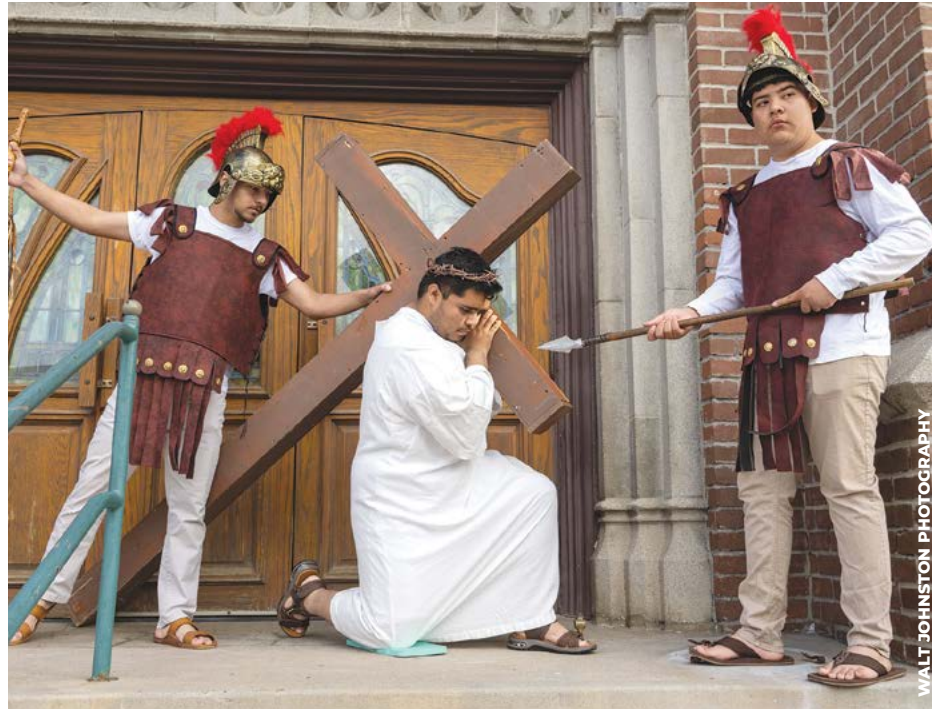
DEVOCIÓN: Los estudiantes de la Escuela Secundaria Cristo Rey San Diego representarán cada una de las Estaciones de la Cruz en la Caminata Anual del Viernes Santo con los que Sufren, que se llevará a cabo este año el 18 de abril.

Esta caminata, la cual inició en 1991, busca conectar la pasión de Jesús con las causas contemporáneas del sufrimiento en la comunidad local, como la falta de vivienda, la trata de personas, el abuso de sustancias, el